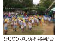
ひじりひがし幼稚園運動会