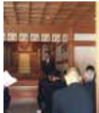
素戔鳴尊神社 秋季例大祭