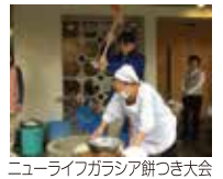
ニューライフガラス餅つき大会