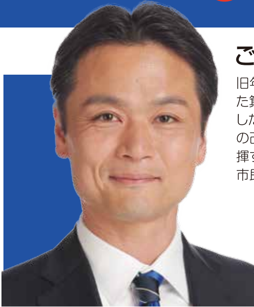
箕面市議会議員1期目/平成28年~