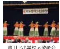
豊川北小学校区敬老会