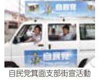
自民党箕面支部街宣活動