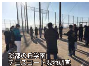
彩都の丘学園 テニスコート現地調査