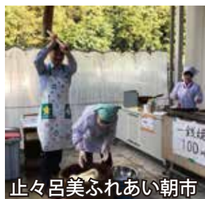
止々呂美ふれあい朝市