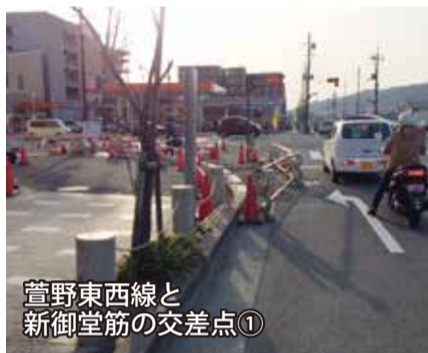
萱野東西線と新御堂筋の交差点①