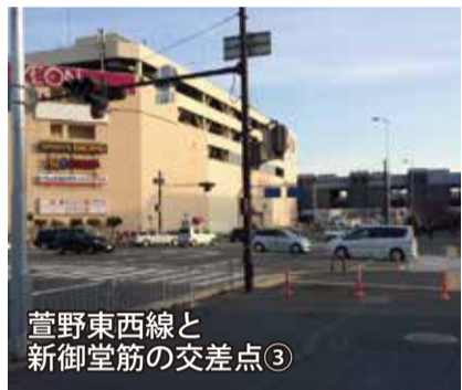
萱野東西線と新御堂筋の交差点③