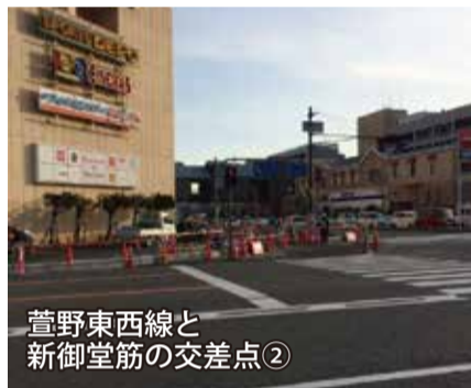
萱野東西線と新御堂筋の交差点②