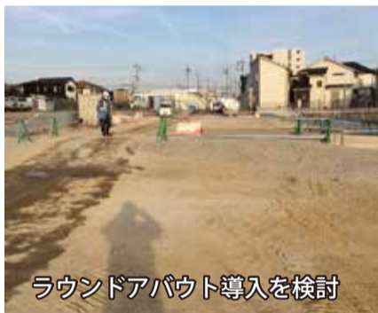
ラウンドアバウト導入を検討

平成30年3月18日には新名神高速道路が全線開通します。これにより箕面今宮線に車両が集中するのではないかと危惧しています。そこで、芝如意谷線を早急に全線開通できるようすべきであると提案しました。